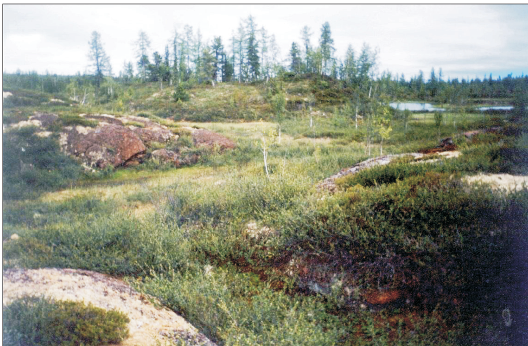
Рис. 1. Мерзлотно-бугристые болотные комплексы в долине р. Черная.

части террасы, который представлен молодым плоскобугристым болотным комплексом, состоящим из мерзлых плоских бугров с небольшой мощностью торфа, микроложбин между ними и термокарстовых микрозападин со вторичными озерками.