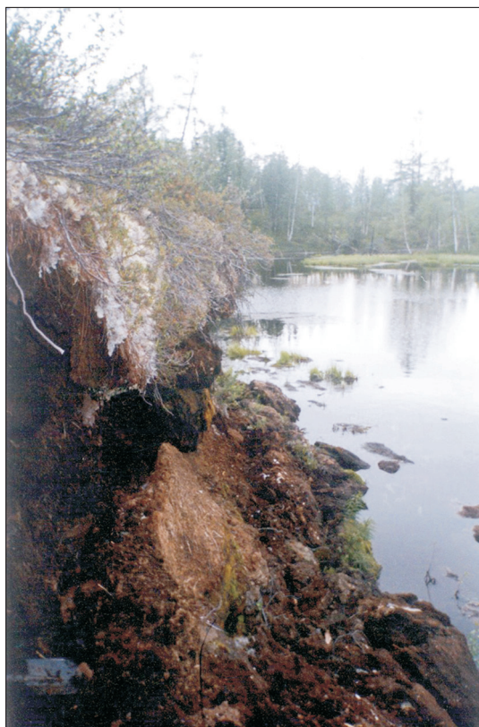
Рис. 2. Общий вид берегового обнажения крупнобугристого торфяника на восточной стороне термокарстового озера.

реговых обнажениях озер, составляет от 0.5 до 4.0 м (рис. 2).