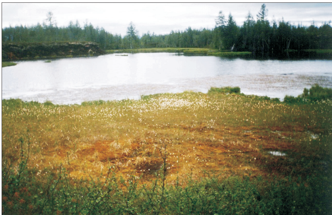
Рис. 3. Вахтово-пушицево-зеленомошная сплавина термокарстового озера на правобережной террасе р. Черная.