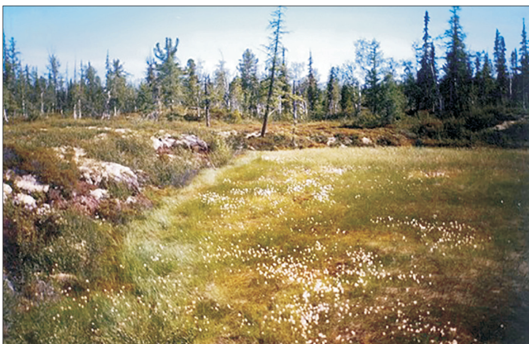
Рис. 4. Плоские бугры пучения, окружающие заросшее термокарстовое озеро на левой надпойменной террасе р. Черная.

На левобережной части второй надпойменной террасы р. Черная преобладают более молодые по возрасту плоскобугристые болотные комплексы, состоящие из обсохших и растрескавшихся уплотненных бугров, сухих микрозападин между ними и обводненных термокарстовых микроочагин со вторичными озерами,